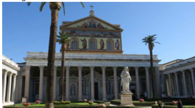
Sankt Paul vor den Mauern

Bei einem ganztägigen Ausflug werden Sie heute die wichtigsten Pilgerstationen der Ewigen Stadt kennen lernen. Zu Beginn fahren Sie zum Park an der Via Appia Antica. Ziel ist die Kirche Sankt Sebastian vor den Mauern , eine „Basilica minor“, die zu den sieben Pilgerkirchen Roms gehört. Die Kirche liegt direkt über dem Komplex der Sebastianskatakomben , die Sie anschließend besichtigen.