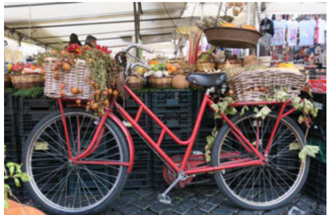
Campo de' Fiori

Bei der Ankunft in Weeze werden Sie bereits erwartet. Gemeinsam fahren Sie mit dem Bus zurück nach Sonsbeck-Balberg.