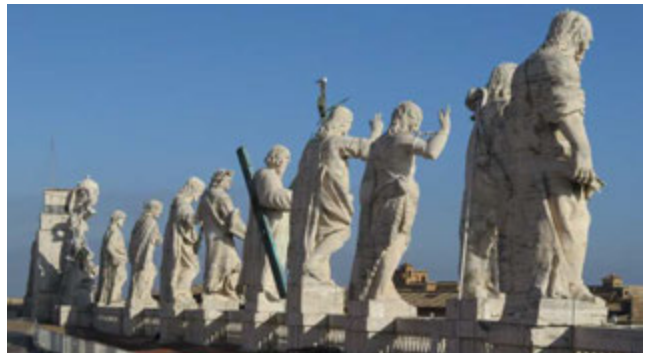
Auf dem Dach von Sankt Peter