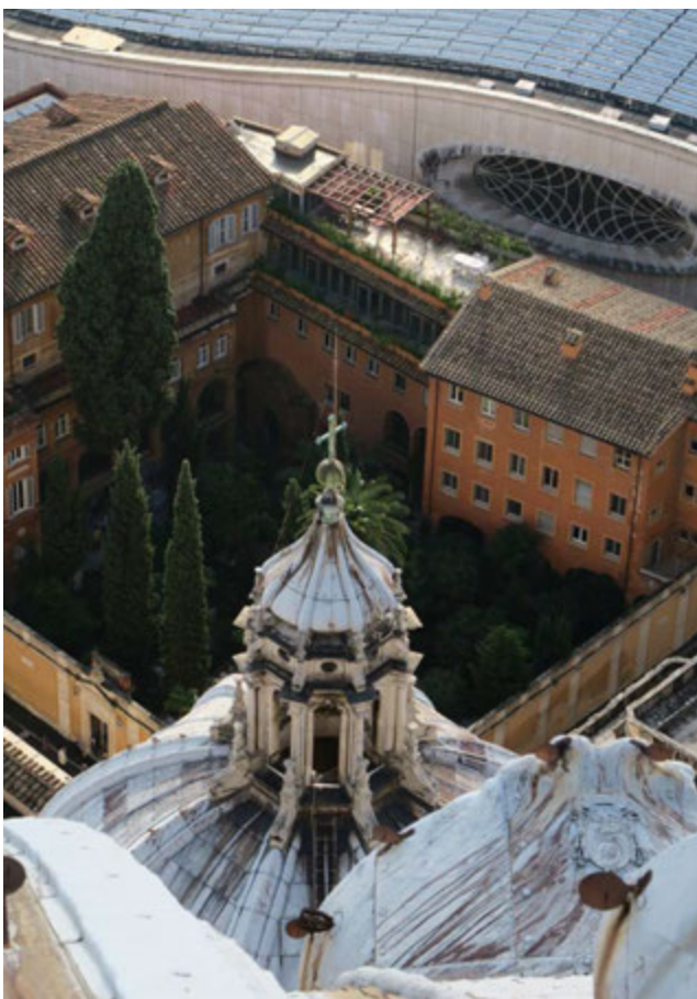
Campo Santo Teutonico

Nach dem Frühstück spazieren Sie in Richtung Vatikan, wo Sie am Sonntagsgottesdienst in der Kirche Santa Maria della Pietà am Campo Santo Teutonico teilnehmen werden.