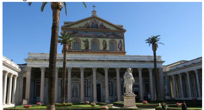
Sankt Paul vor den Mauern

Bei einem ganztägigen Ausflug werden Sie heute die wichtigsten Pilgerstationen der Ewigen Stadt kennen lernen. Zu Beginn fahren Sie zum Park an der Via Appia Antica. Ziel ist die Kirche Sankt Sebastian vor den Mauern , eine „Basilica minor“, die zu den sieben Pilgerkirchen Roms gehört. Die Kirche liegt direkt über dem Komplex der Sebastianskatakomben , die Sie anschließend besichtigen.