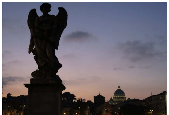
Engelsbrücke am Abend