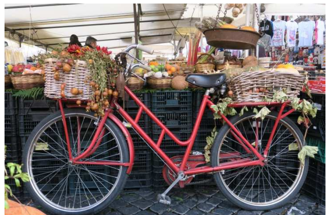
Campo de' Fiori

Bei der Ankunft in Weeze werden Sie bereits erwartet. Gemeinsam fahren Sie mit dem Bus zurück nach Sonsbeck-Balberg.