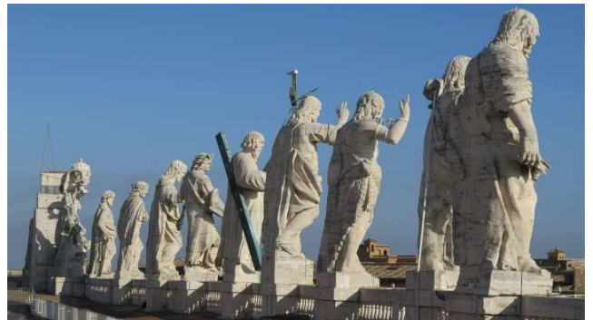
Auf dem Dach von Sankt Peter